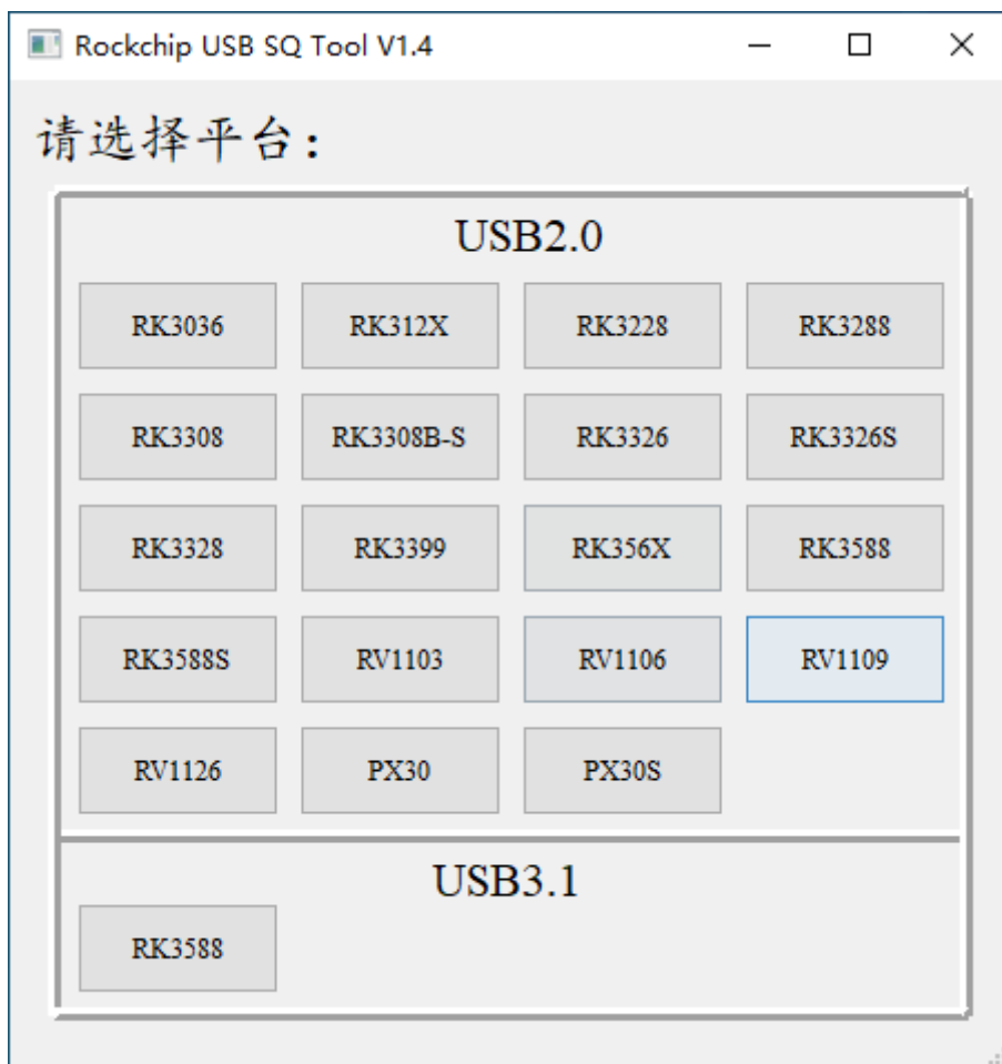
图1 USB SQ TOOL Main Window

注意： PHY Tuning 请按照工具页面中的顺序进行调整，只有在前面的调整步骤没有改善或者无法满足要求的情况下，再开启下一个步骤的调整（有些参数的调整可能对结果影响很小，那么可以忽略跳过这些步骤）。USB信号的调整具有一定的风险，不可盲目的调整，最好能测试眼图时对着眼图去适当的调整，调整到能满足需求即可，而不是调整越大越好。用户需要自己把控调整风险。